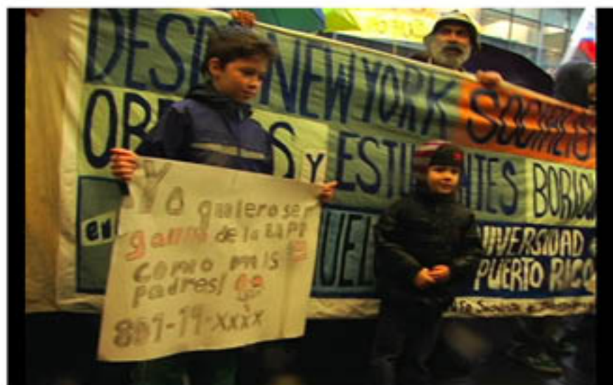
MULTIPLE ARTISTS (Edited by SOFÍA GALLISÁ MURIENTE) Solidarity videos from around the world, 2012 DVD (Still Image from video)